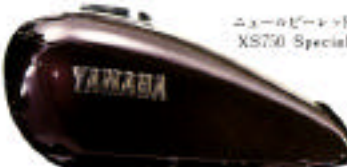
ニューロビートフ XS750 Special