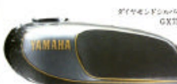
ダイヤモンブルー GS750

メーターは左にスピードメーター、右にタコメーター。夜間照明時はオレンジ色の文字が輝きあ