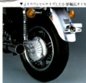
▼よりスペシャルなサイズした小径細径タイプ