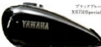
ブラックブルー XS750 (Special)